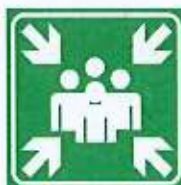
Znak za zbirno mesto (BS 5499)

Zbirno mesto je določeno v posameznem načrtu evakuacije in se nahaja na prostem, kjer je označeno z znakom za zbirno mesto (na sliki spodaj), v kolikor je to mogoče.